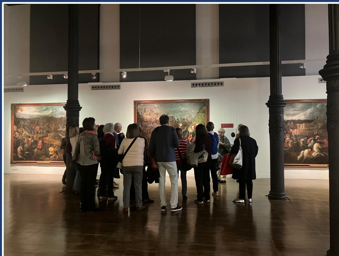
7 de noviembre "Teatro y Pintura. Aragón y el Ducado De Villahermosa". Paraninfo