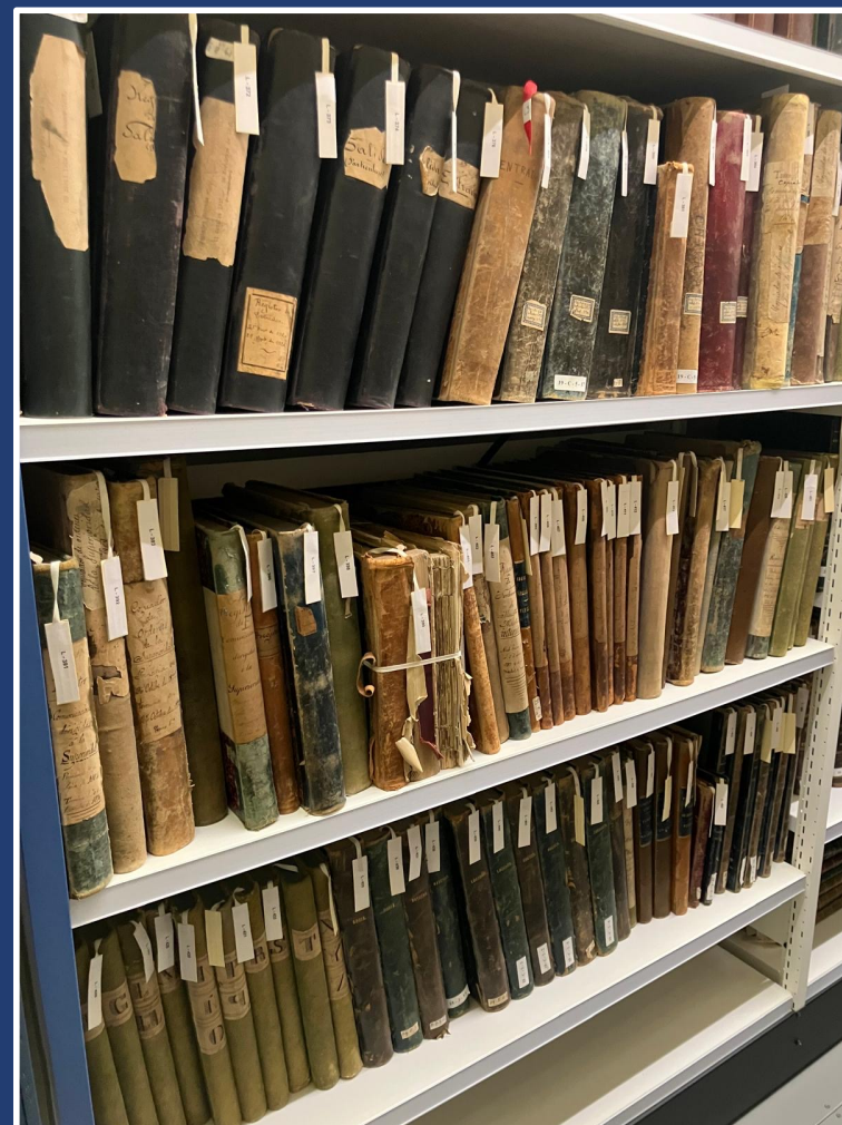
13 de noviembre Archivo Histórico de la Universidad de Zaragoza. Paraninfo