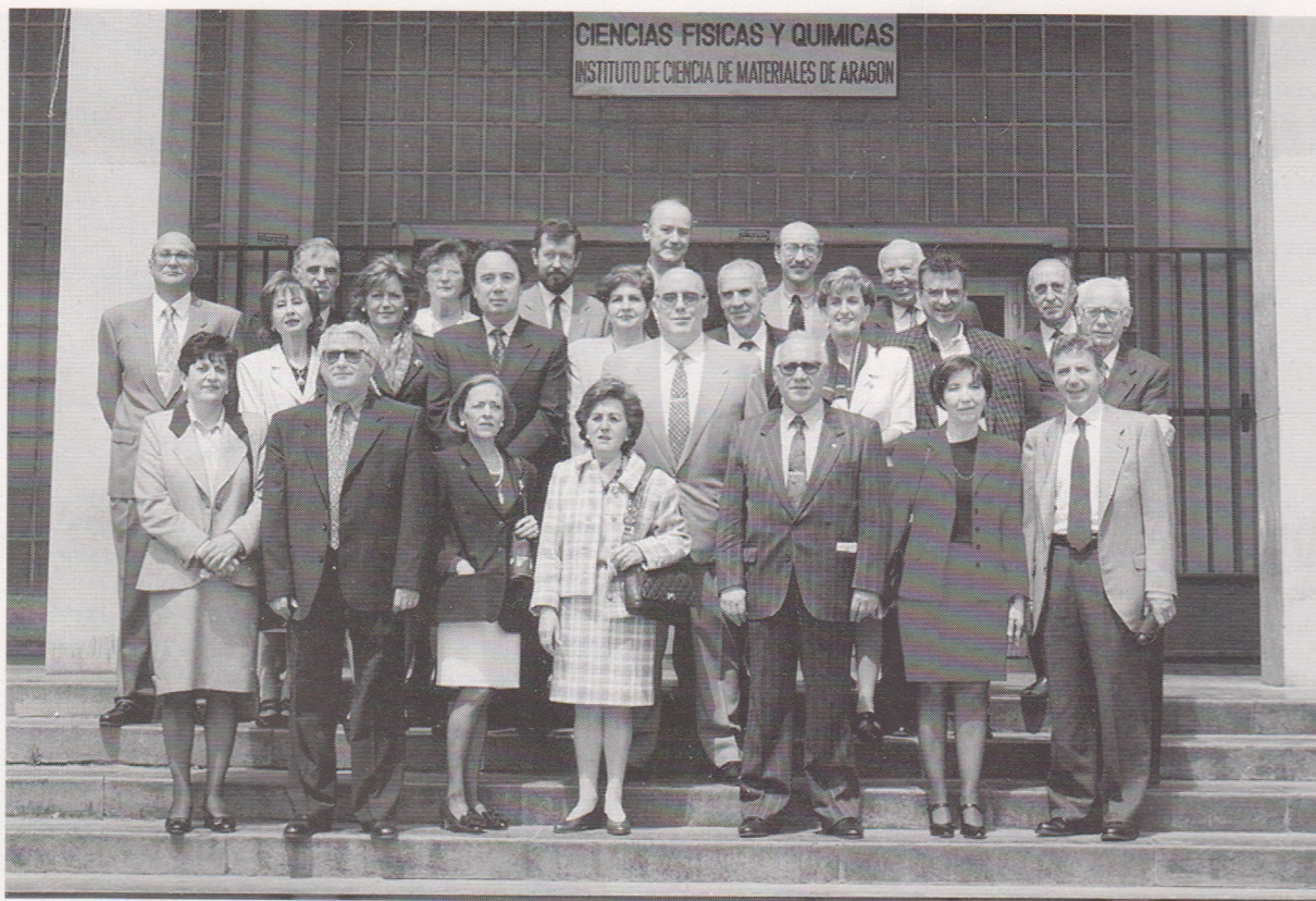
30º Aniversario Promoción Ciencias Físicas (1966-1996)

Mi reflexión final es si la Universidad sabrá renovarse o acabará extinguiéndose dentro de esta sociedad decadente.