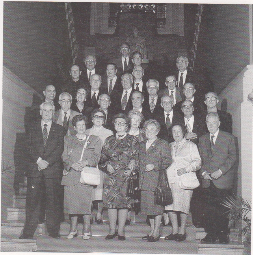
Bodas de Oro Ciencias Químicas (1946-1996)

Seguimos intentando que AGRALUZ sea conocida por el mayor número posible de ex-alumnos. Para ello, la Oficina de Graduados se ha puesto en contacto con multitud de Colegios Oficiales para publicar en las diferentes publicaciones de éstos algún artículo informativo.