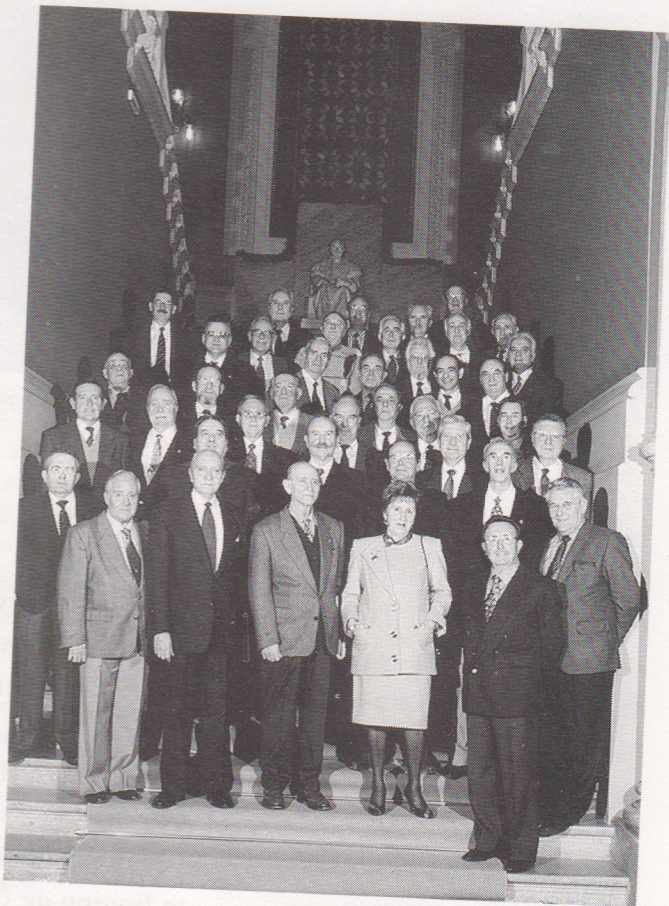
40º Aniversario Promoción Médica (1956-1996)