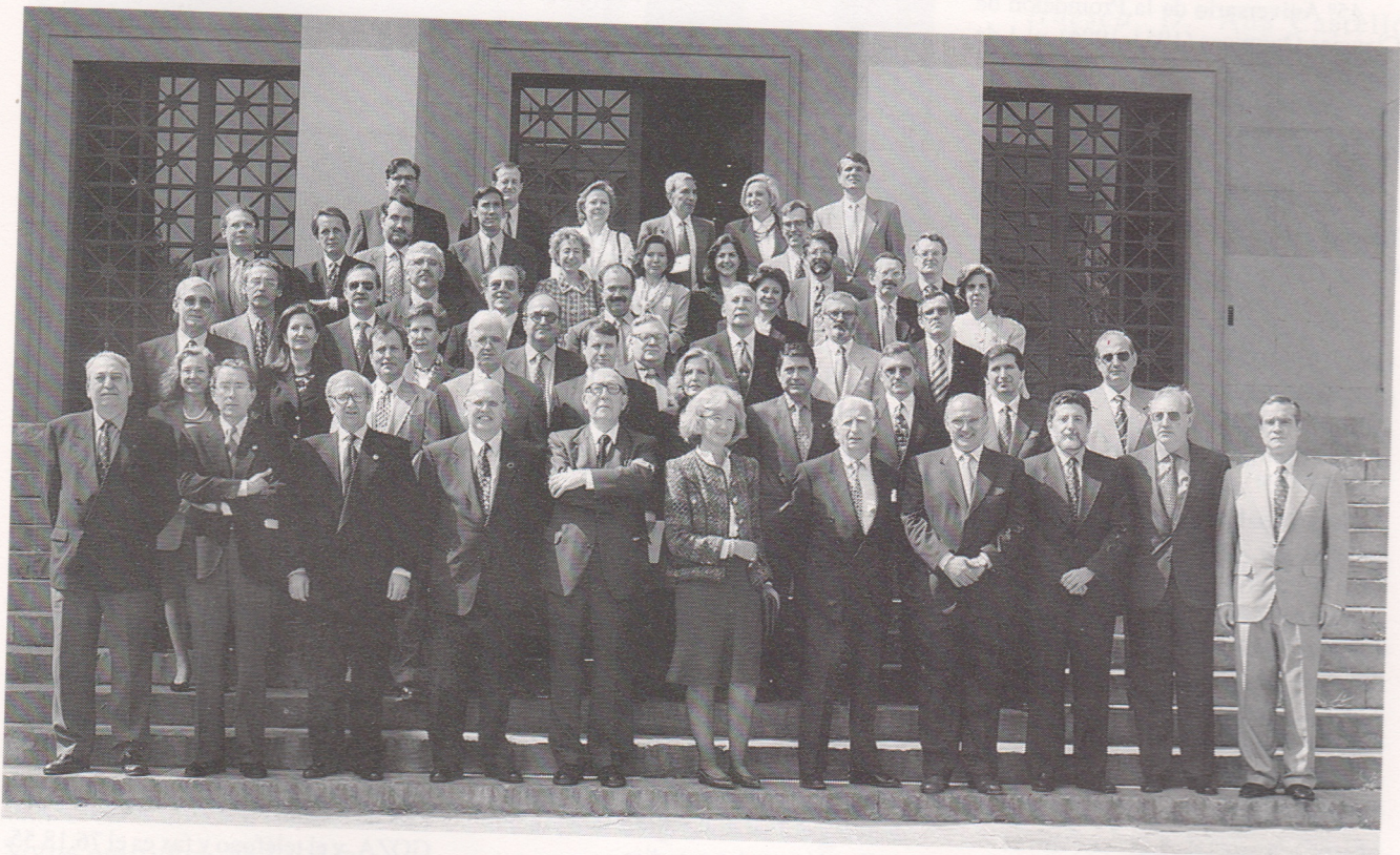
Promoción de Derecho (1971-1996)

Terminamos los actos con un almuerzo servido en el Paraninfo de la Universidad y nos despedimos, llenos de promesas para quedar, llamarnos y escribirnos. La realidad diaria, nuestras ocupaciones, la ajetreada vida que todos llevamos, posiblemente impedirá cumplir estas promesas, pero tenemos la seguridad de que, al menos, cada cinco años, volveremos a reencontrarnos.