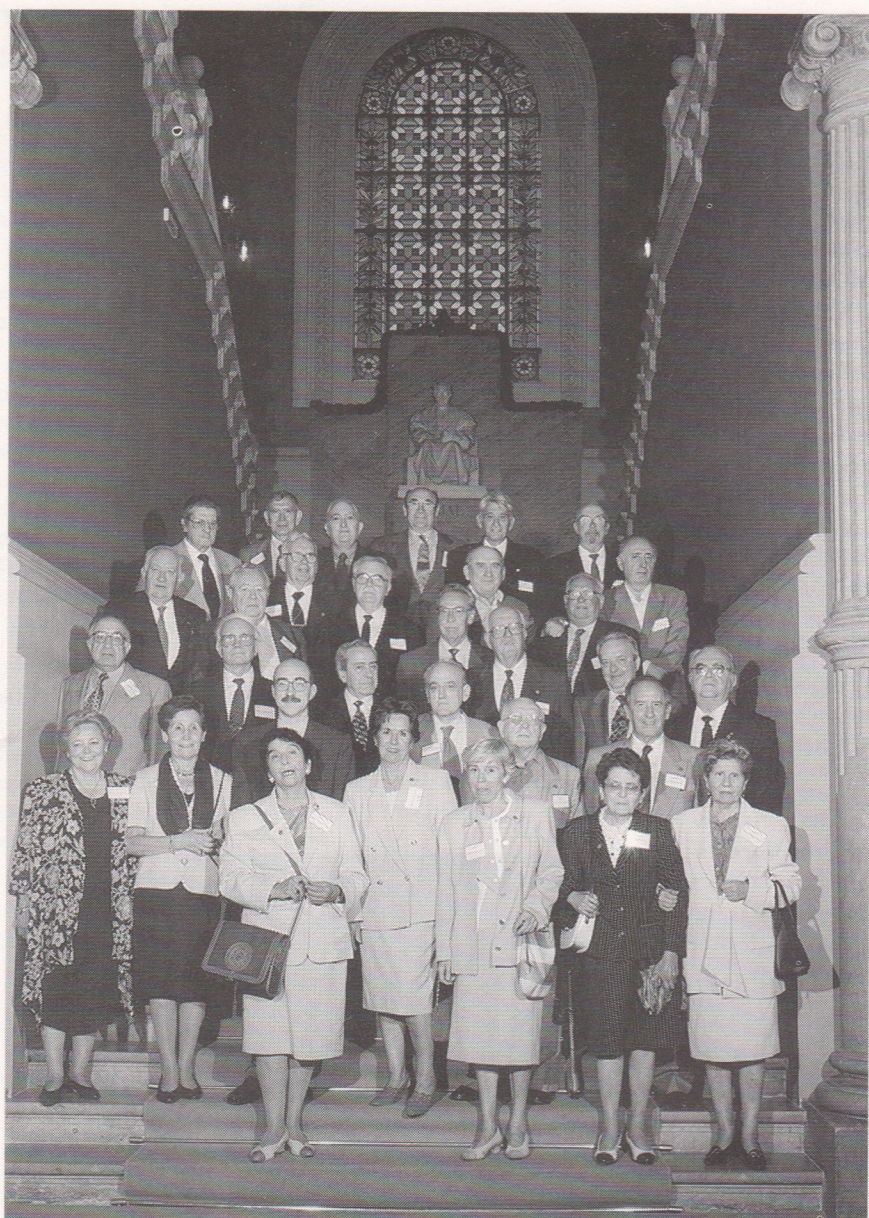
45º Aniversario Promoción Ciencias-Químicas (1951-1996)

Para la Universidad, el pasado día 31 de mayo fue una jornada electoral. Trescientos claustrales debían votar a uno de los dos candidatos a Rector para los próximos cuatro años (1996-2000). He aquí los datos: