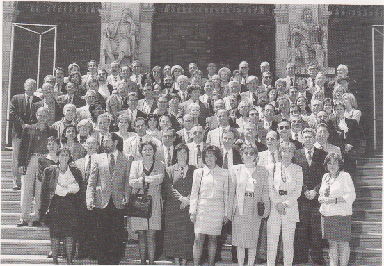
Bodas de Plata Promoción Médica (1971-1996)

Dirección de contacto: Somerondón. C/ Domingo Miral, 4. Edificio Servicios. 50009 ZARAGOZA. Teléfono: 76.13.53