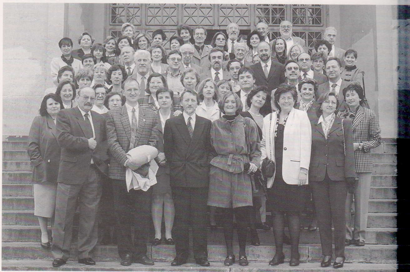
Bodas de Plata Promoción Filosofía y Letras (1971-1996)