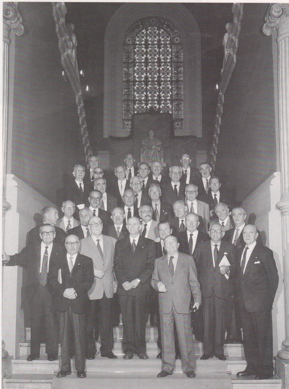
Bodas de Oro de la Promoción Médica (1946-1996)