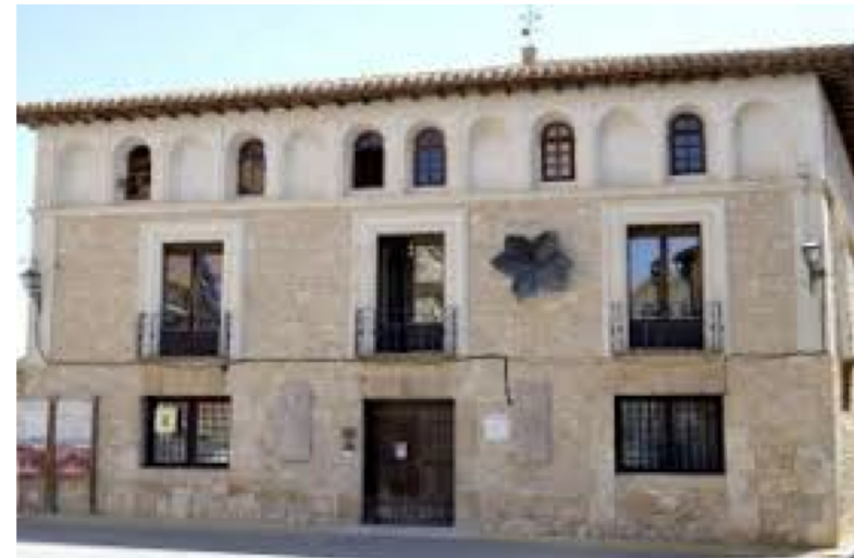
Museo del azafrán. Monreal del Campo.

La palabra museo nació en Grecia y se refería al templo de las Musas que en su amplia mitología eran las representantes de las artes, las letras y las ciencias. Tendremos que esperar hasta el siglo XVIII nada menos para que la palabra tenga un significado más concreto y más parecido al del ICOM (Consejo Internacional de Museos) en sus Estatutos del año 2007: “Un museo es una institución sin fines lucrativos, permanente, al servicio de la sociedad y de su desarrollo, abierta al público, que adquiere, conserva, investiga, comunica y expone el patrimonio material e inmaterial de la humanidad y su medio ambiente con fines de educación, estudio y recreo.”