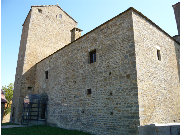
Museo del Dibujo. Larrés.

Los podemos encontrar dedicados a la temática más variopinta. Encabezados numéricamente por los etnológicos, les siguen los que aúnan pintura y escultura, los de pintura exclusivamente; al vino, personajes locales, aceite, minería, paleontología; solo escultura, juegos, arte sacro, semana santa, yacimientos concretos, apicultura y miel; electricidad, alfarería, brujería, escuela, chocolate, pastelería; pan, azafrán, remolacha, fauna, aves, taurino, magia; armas de asedio, bolsa de Bielsa, Guerra Civil, miniaturas militares, oficios, calzado, bastones, numismática, momias, motos, ferrocarril, dibujo, etcétera.